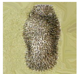
Ein kranker Igel ist dagegen mager wie oben und unten abgebildet.

Wenn ein Igel tagsüber gefunden wird, ist das ein Zeichen, dass etwas nicht in Ordnung ist. Zwar kann ein Igel auch am Tag unterwegs sein, einfach weil er von seinem Nest vertrieben wurde und nun auf der Suche nach einem sichereren Ort für sich oder für seinen Jungen ist. Aber normalerweise zeigt das, dass der Igel verletzt oder krank ist. Falls die Wunde einige Tage alt ist, kann sie nach verrottetem Fleisch übel riechen. Oft hat der Igel bereits Madeneier auf der Wunde und vielleicht sogar auf dem ganzen Körper besonders in den Körperöffnungen oder noch schlimmer bereits Maden, die ihn lebend auffressen. Madeneier und Maden kann man auch einfach auf kranken Igel finden. Ein Igel in diesem Zustand benötigt sofortige Hilfe und man muss das nächste Igelzentrum anrufen und ihn dorthin bringen (oder zum nächsten Tierarzt, sollte kein Igelzentrum in der Nähe sein. Tierärzte sind verpflichtet, wilde Tiere unentgeltlich zu behandeln und sie an die nächstgelegene Igelstation weiterzugeben).