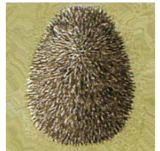
So sieht ein gesunder Igel aus (Bild oben)

Einen Igel nachts zu beobachten, ist völlig normal: Der Igel ist ein Nachttier und in einem solchen Fall soll man ihn auch dort belassen. Befindet er sich am Rand einer starkbefahrenen Strasse, kann man ihn an einen sicheren Ort bringen, aber nie weiter als 50 – 100 m vom Auffindungsort. Ihn mehrere Kilometer weit zu bringen, tut man mehr schlecht als gut: ein solcher Igel würde die neue Gegend nicht kennen und deshalb drohen ihm mehr Gefahren als vorher. Sollte es sich sogar um ein Weibchen handeln, dann würden die Jungen, die im Nest auf der Mutter warten, sterben. Nie einen Igel nach hause oder noch schlimmer in die Schule bringen, um ihn den Kindern zu zeigen. In einem solchen Fall wird der Igel unnötigem "stress" unterzogen, und er kann davon leicht krank werden. Handelt sich wiederum um ein Weibchen, könnte es, wenn es wieder befreit wird, seine Junge töten, da sie geschwächt aufgefunden werden.