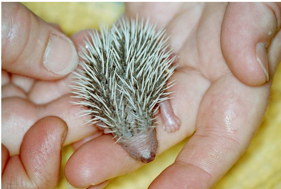
Dal nostro CCRM la foto di un cucciolo di riccio nato da pochi giorni.

Cari soci e sostenitori degli Amici del Riccio,