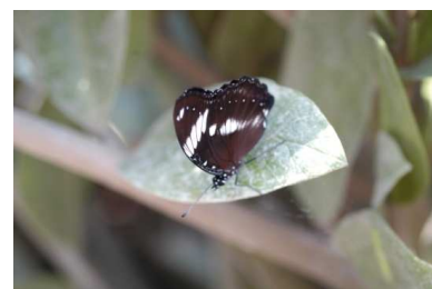
Gaia (10 anni)

Al Papiliorama c'erano tre tendoni dove c'era 1) papiliorama 2) nocturama 3) jungle treek. Poco più in là vi era una voliera delle farfalle svizzere.