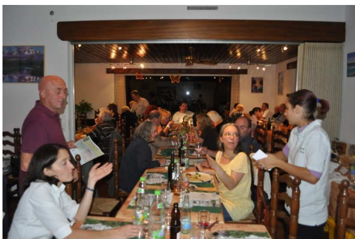
Una buona cena