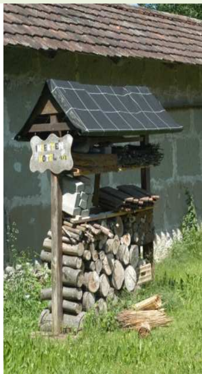
Casa per insetti

Abbiamo potuto ammirare bellissime farfalle animali notturni e animali della giungla presso il Papiliorama a Kerzers (FR)