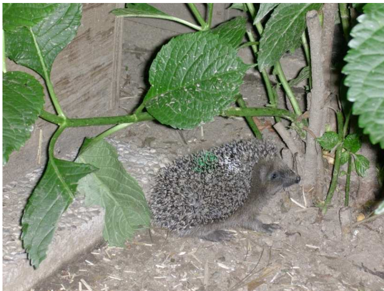
Barbazoo della famiglia di Barbamamma (giugno 2009)

Cari soci e sostenitori degli Amici del Riccio,